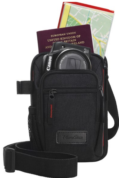
Alles dabei: die Minimallösung für die Fotoreise.

Je nach Ort sollte man allerdings überlegen, ob man nicht besser zu einem unauffälligen Rucksack oder einer dezenteren Tasche greift, um Langfinger erst gar nicht auf die kostbare Fracht aufmerksam zu machen. Ideal dafür sind beispielsweise der Canon Rucksack Backpack BP10 oder die Canon Kuriertasche Messenger Bag MS10, die beide jeweils Platz für eine DSLR, zwei Objektive, ein Stativ, ein Tablet sowie persönliche Gegenstände bieten, dabei wegen ihres dezenteren, „urbanen“ Designs aber nicht wie Kamera-, sondern eher wie klassische City-Taschen wirken.