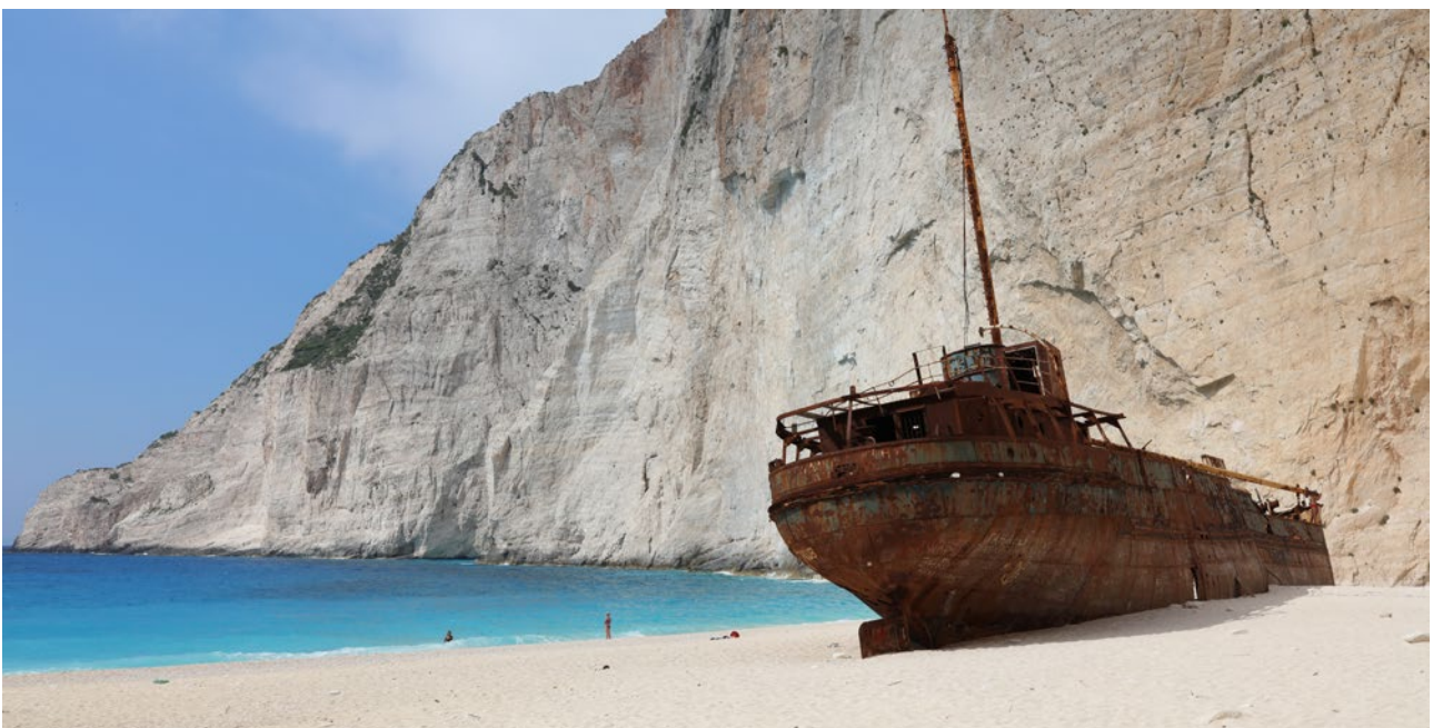
Ein angenehm natürlich wirkender Bildwinkel zeichnet dieses Bild aus, das mit dem EF 35mm F1.4L II USM Weitwinkelobjektiv fotografiert wurde.