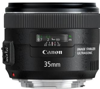
Das EF 35mm F2 IS USM ist ein feines Reiseobjektiv für Vollformatkameras.

Für die spiegellosen EOS Kameras der R-Reihe steht das Canon RF 35mm F1.8 IS Macro STM Objektiv mit Hybrid IS zur Verfügung.