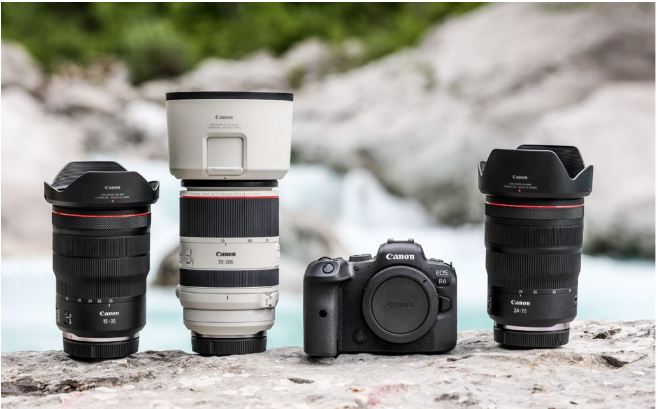
Robust ausgerüstet: Die EF-Objektive der L-Serie, erkennbar am roten Ring, sind gegen Staub und Spritzwasser geschützt.