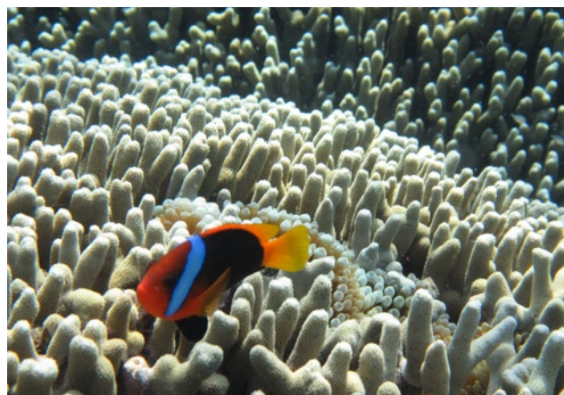
Dicht unter der Wasseroberfläche leuchten die Farben besonders bunt.

Neben dem Gehäuse gibt es noch eine Reihe weiterer Besonderheiten unter Wasser zu beachten. So sollte man, wenn möglich, leicht von unten fotografieren, um mehr Plastizität und das Blau des Meeres ins Bild zu bekommen.