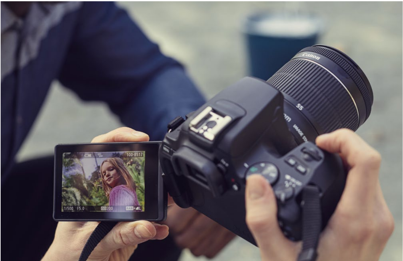
EOS 250D: Kompakte DSLR mit APS-C-Sensor, die kompatibel mit mehr als 80 EF- und EF-S-Objektiven ist.