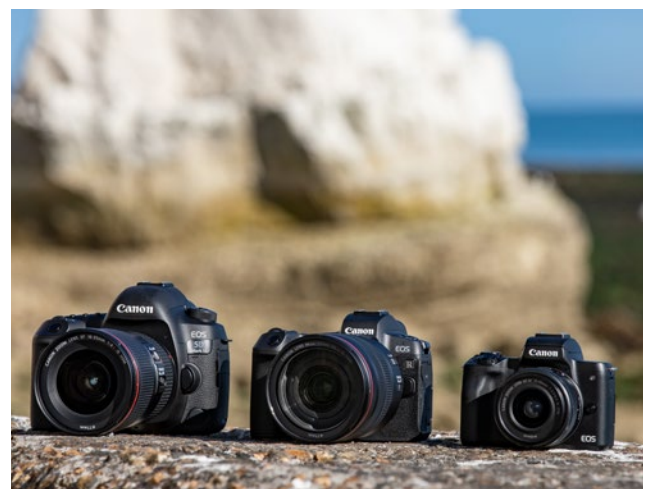
Größenvergleich: EOS Vollformat-DSLR, EOS R und EOS M mit APS-C Sensor.

Die dritte Alternative besteht in der Mitnahme einer einzigen Kamera, die kompakter ist als eine DSLR – aber ähnlich flexibel und leistungsstark. Die spiegellosen EOS-M-Systemkameras nehmen es mit der Qualität einer APS-C-Kamera auf und sind im Urlaub der ideale Reisebegleiter.