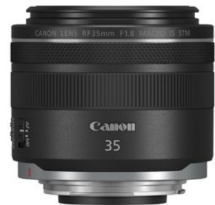
Das RF 35mm F1.8 IS Macro STM ist ideal für die Reisefotografie mit dem EOS R System.