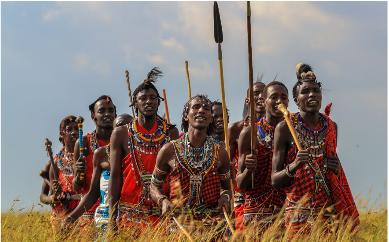
Maasai mit ihren farbenprächtigen Gewändern sind quasi ein Muss-Motiv für Kenia-Reisende.