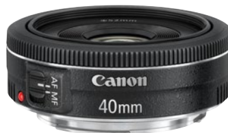
Noch kompakter ist das EF 40mm F2.8 STM im flachen „Pancake“-Format.