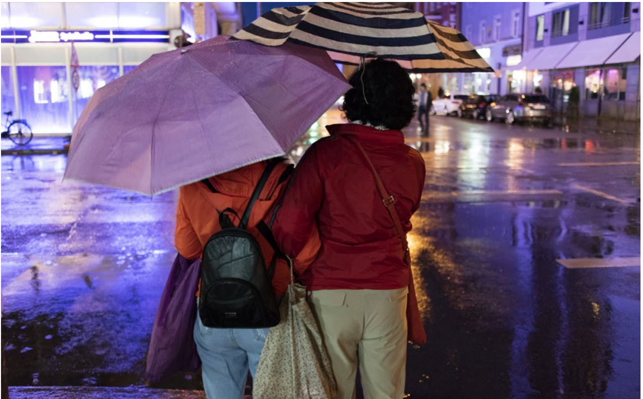
Ob natürliches Licht oder, wie hier, Kunstlicht: Das Licht bestimmt die Farben.