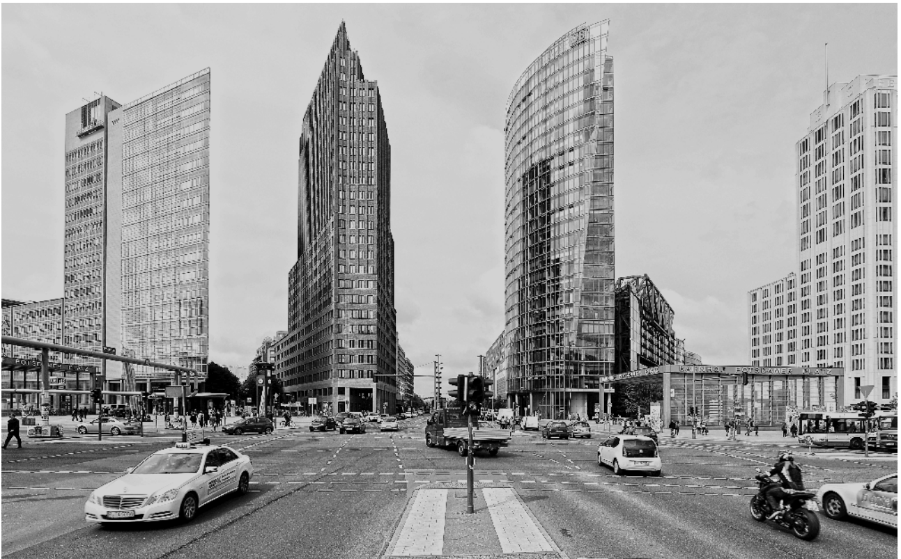
Weitwinkelaufnahmen setzen die Stadtarchitektur in Szene.