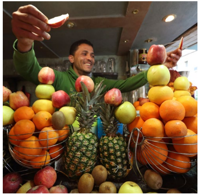
Ein Weitwinkelzoom fängt die ausladende Bewegung ein. Bei dieser Aufnahme kam das EF-S 10-22mm F3.5-4.5 USM zum Einsatz.

Tipp 1: Wie in der Landschafts- und Stadtfotografie, so gilt, zumindest im Sommer, auch für das Portrait: Das Morgen- und Abendlicht schmeichelt dem Motiv. Steht die Sonne im Zenit, sind die Kontraste meist zu hart. Dann hilft meist nur noch ein Aufhellblitz.