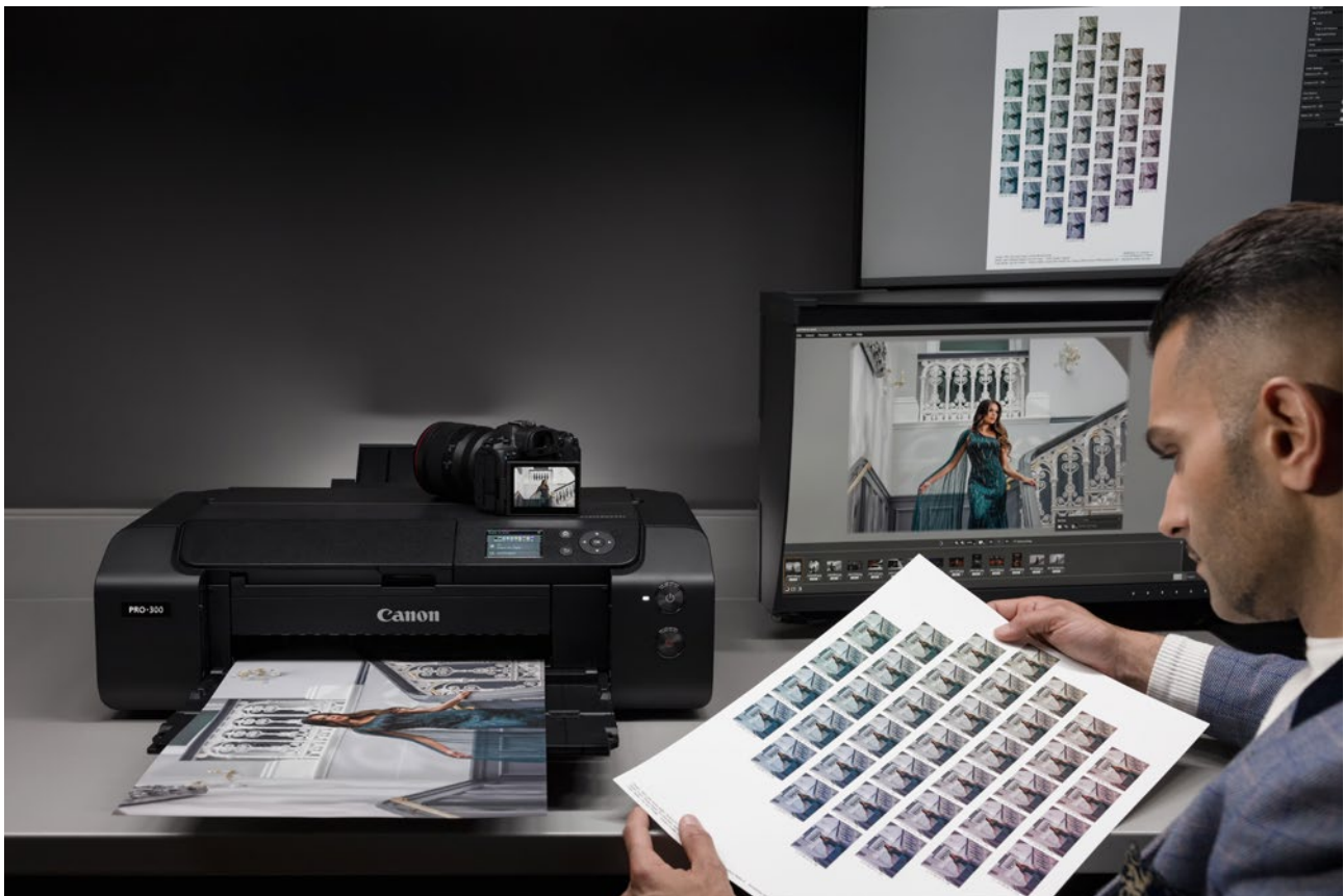
Die schönsten Motive einer Reise bleiben als Fine-Art-Prints nachhaltig in Erinnerung.

Tipp: Am besten lässt sich eine Reise in Form eines echten Fotobuchs nacherzählen. Beim Canon HDbuch hilft die Software beim Erstellen individueller Layouts, die Produktion erfolgt im Labor. Das Besondere: Das Canon HDbuch wird im Inkjetdruckverfahren gedruckt, das Bilder besonders detailreich und mit integrierter Schrift extrem scharf wiedergibt. Zudem verspricht es eine lange Haltbarkeit, die sogar fotochemische Fotobücher übertrifft.